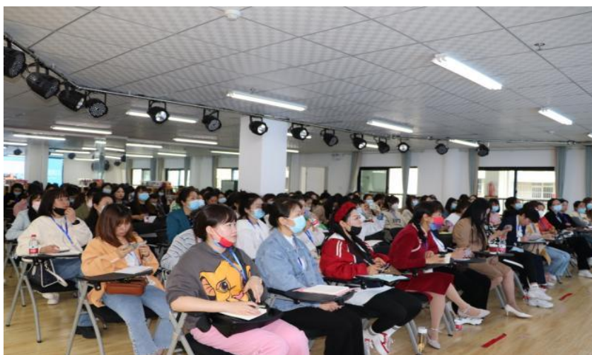
讲座分享中老师们仔细聆听