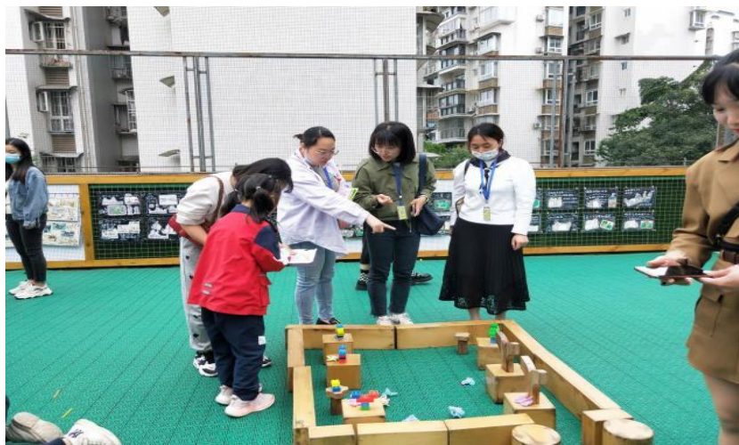
工作室成员在观摩中与幼儿互动、交流