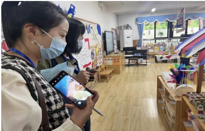
工作室成员观摩班级环境

分享结束后，在洙幼老师的带领下所有老师更深入地了解班级环境和各功能室，充分了解到洙幼老师根据园所环境挖掘资源、合理规划创设的赋有文化，参观了动能的游戏环境，也近距离观看到幼儿在多功能、多层次、多元化的环境中自主进行探索、交往、操作。